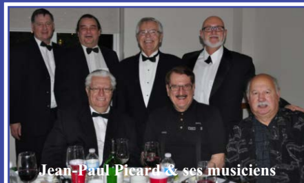
Jean-Paul Picard & ses musiciens