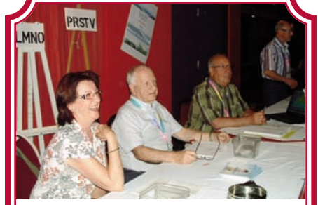
Le comité d'accueil vous reçoit chaleureusement