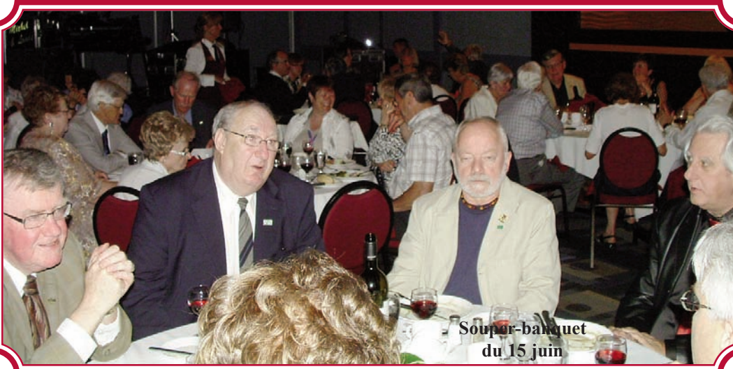
Souper-banquet du 15 juin