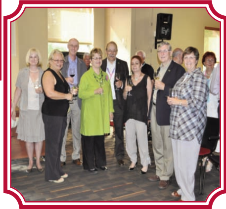
Cocktail offert par la ville de Rivière-du- Loup au conseil des présidents