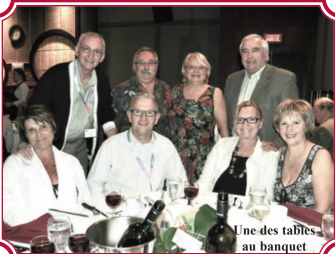
Une des tables au banquet