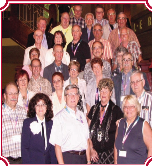
le conseil des présidents et le conseil d'administration de l'AQDER 2011