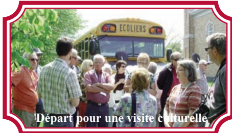
Départ pour une visite culturelle

Pour voir les photos couleurs, cliquer sur ce lien et autoriser: http://web.me.com/yamellaer/aqder/