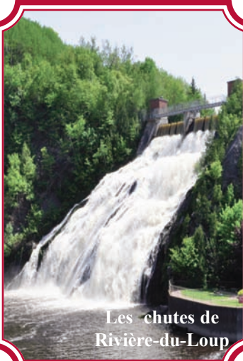
Les chutes de Rivière-du-Loup