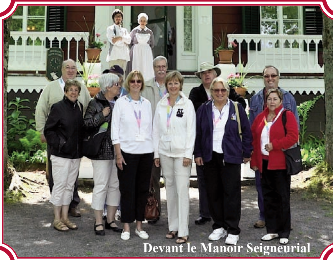
Devant le Manoir Seigneurial